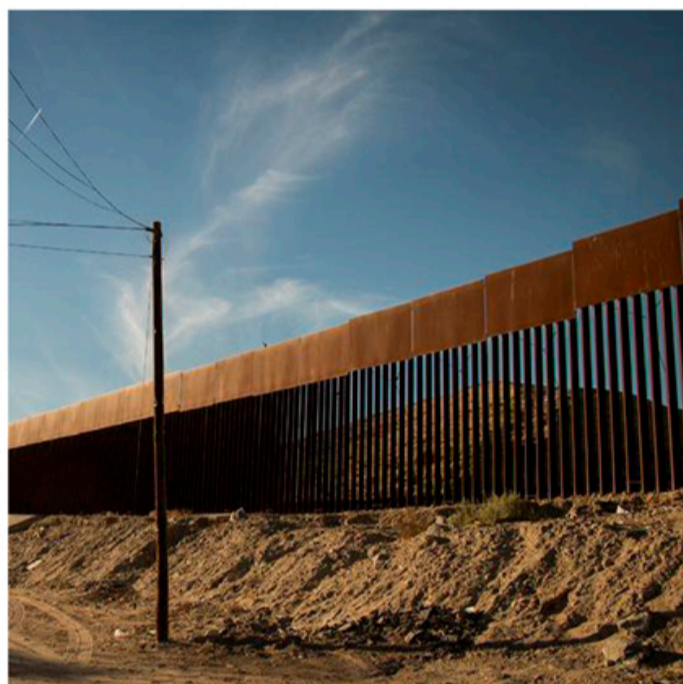
AVSPÄRRAT. Ett högt stängsel sträcker sig längs gränsen mot USA i Algodones.